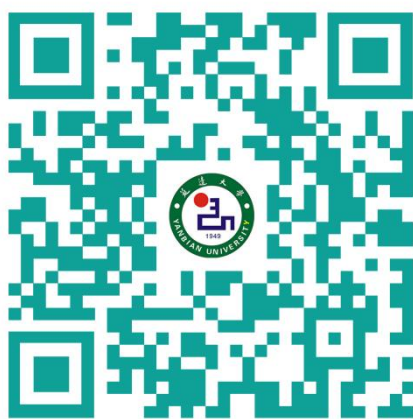
延边大学 2024 届毕业生生源信息

学校面向全国 31 个省市、自治区招生，现有全日制在校学生 29,447 人(其中博士、硕士研究生 6,524 人，本科生 21,175 人，专科生 1,748 人)，来自 15 个国家的留学生 110 人。