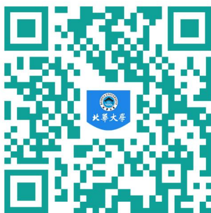
北华大学 2024 届硕士毕业生生源信息表

学校是全国文明单位、全国大学生文化素质教育基地、国家语委语言文字应用培训基地、全国首批卓越医生和卓越农林人才培养计划项目改革试点高校、国家大学生创新创业训练计划项目学校、全国高校毕业生就业典型经验高校和全国高校实践育人创新创业基地。