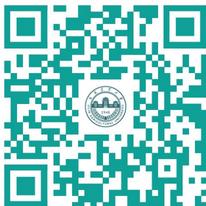
吉林农业大学 2024 届毕业生信息汇总表

学校现有全日制在校生 23700 余人，现有 73 个本科专业，15 个国家级一流本科专业建设点专业；7 个国家级特色专业；2 个国家专业综合改革试点专业；21 个省级一流本科专业建设点专业；15 个省级特色高水平专业；13 个省级特色专业；9 个省级品牌专业；各类实践教学基地 390 个。多年来，毕业生毕业去向落实率始终处于全省高校前列。